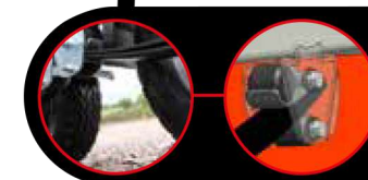
Nugent Dual Drive™ Suspension